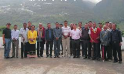
▲ナガランドの教会指導者の方々と