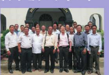
▲インパールの教会指導者の方々と

環太平洋リバイバルミッションの一端として、インド東北部におけるリバイバルミッション開催の可能性を求め、6月末にマニプール州インパールとナガランド州コヒマを訪問し、現地のキリスト教指導者の方々と話し合いの時を持つことができました。この二つの町は第二次世界大戦末期に多大な犠牲者を出したインパール作戦の舞台となった場所で、日本との関係が深く、その地のリバイバルミッション開催には深い霊的な意義があると思われれます。