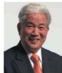
●全日本リバイバルミッション主幹

イエス様は、「神を信じなさい。山に向かって『動いて、海にはいれ。』と言って、心の中で疑わず、ただ、自分の言ったとおりになると信じるなら、必ず祈りはきかれる」と語っておられます。イエス様が空腹のためいちじくの実を求めたとき、葉だけで実がないいちじくの木をのろわれたので、いちじくの木が枯れたことが聖書に記されていますが、いちじくは2回実がなります。最初の実が芽を出すと同時に実がなるのです。初なるの果実—はじめの愛—を、主は私たちに求めておられるのです。