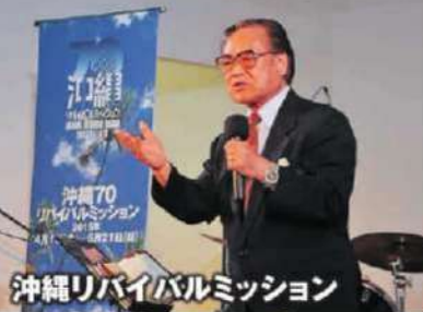
沖縄リバイバルミッション