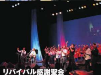
リバイバル感謝聖会