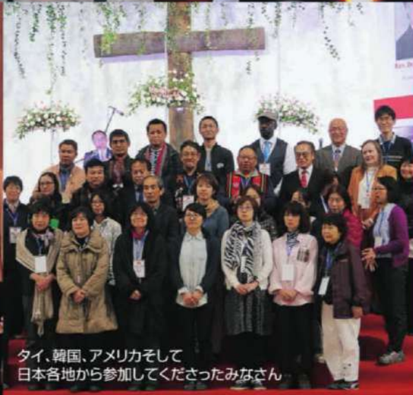
タイ、韓国、アメリカそして 日本各地から参加して下さったみなさん