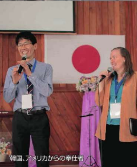
韓国、アメリカからの奉仕者