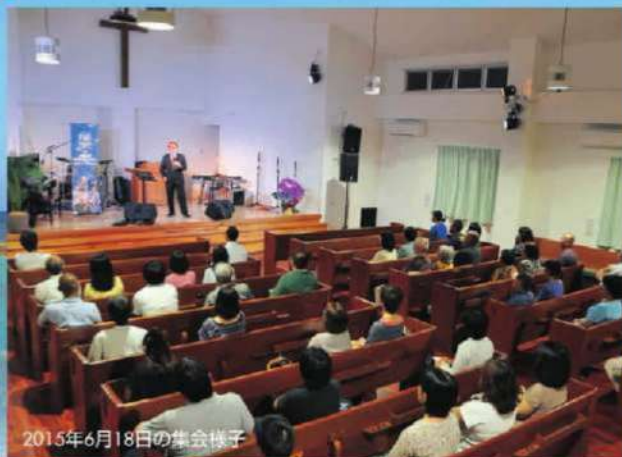
2015年6月18日の集会様子