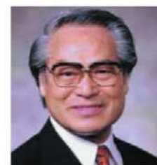
私たちもやり抜きます。

47都道府県巡回伝道が継続されます。神の栄光、救霊のために更なるお祈りと御支援をお願い致します。