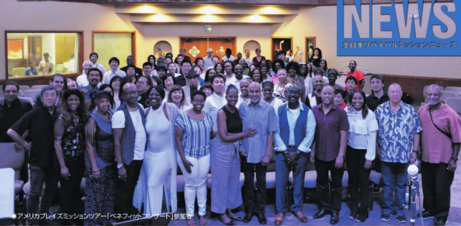
●アメリカレイズミッションツアー「ベネフィットコンサート」参加者

1980年代テレビコマーシャルで話題になったアホートルという生物がいます。通称ウーパールーパーと呼ばれ、とっても愛らしい動きをします。全長10~25センチ、メスよりもオスの方が大型になり、メスは最大でも全長21センチ。通常は幼生の形態を残したまま成熟します。胴体は分厚く、皮膚の表面が滑らですが、粒状の突起がある個体もいます。メキシコシティ周辺のいくつかの湖に限りて生息しているイモリに似た動物です。1865年パリの植物園で飼育中、たまたまサンショウウオになり、両生類に属するメキシコサンショウウオの幼生型だということがわかったそうです。しかし、アホートルは一般に親になることがなく、一生を幼生型の姿で送るそうです。彼らは親にならないのに、それなりに成熟して、アホートルがアホートルを産み続けていくそうです。これは幼生型と呼ばれ、世界的にも珍しい個体だそうです。