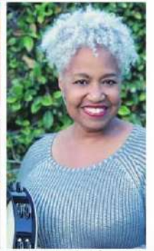
フィリス・セント・ジェームス