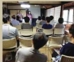
◎萩ハレルヤ!キリスト教会