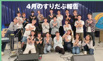
4月のすりだぶ報告

会場/ 新城教会・教育館ホール [入場無料/ 自由献金] リバイバルミッションYouTubeより生配信 ぜひご家族や友人への伝道にお用いください! また開催にあたっての献金とお祈りのサポートもお願いいたします。 こちらのイベントのチラシを必要な方に無料でお送りします(10枚より)ご希望の方はsuridabu.rm@gmail.comまでお問い合わせください。