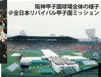
阪神甲子園球場全体の様子 ◎全日本リバイバル甲子園ミッション

神は『神の賜物を、再び燃え立たせてください。』そして『神が私たちに与えてくださったものは、おくびょうの霊ではなく、力と愛と慎みとの霊です。』と語っています。