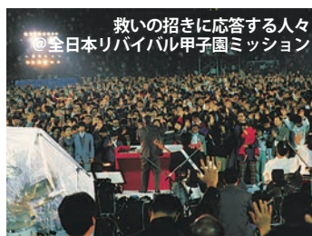
救いの招きに応答する人々 ◎全日本リバイバル甲子園ミッション

1993年11月5日～7日に行われた「全日本リバイバル甲子園ミッション」が兵庫県西宮市にある甲子園球場で行われました。その当時を振り返ると一人ひとりに素晴らしい賜物が与えられ、熱い祈りを主にささげ、その結果多くの方が主を信じるという神の栄光を見る事ができました。しかしあれから 32年が経ちました。今の教会に、今も熱く聖霊の火が燃えているのでしょうか？日本にリバイバルが起こされるように祈っているのでしょうか？今のコロナ後の教会を見ると、現実的な教会になっていないかと思わさせられます。現実的とは①考え方などが現実に即しているさま。「～な方法」②理想や夢がなく、実際の利害にのみさといさま。「～で夢のない人」という意味です。