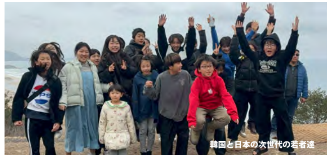
韓国と日本の次世代の若者達

5日間のツアーを通して、私たちは「宣教の弓矢」として整えられました。モンゴル、韓国、日本、この三つ撚りの糸の働きこそが、これからの世界宣教において不可欠な鍵となることを確信しています。全てを守り、素晴らしい出会いと天候、そして豊かな霊的糧を与えてくださった神様に、心からの感謝と栄光を捧げます。ハレルヤ！